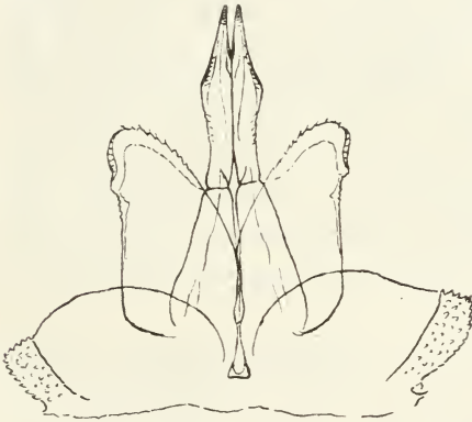
Fig. 1. Trichoniscus rhenanus Graeve. ♂. Pleopoden des 1. Paares. Vergr. 90:1.